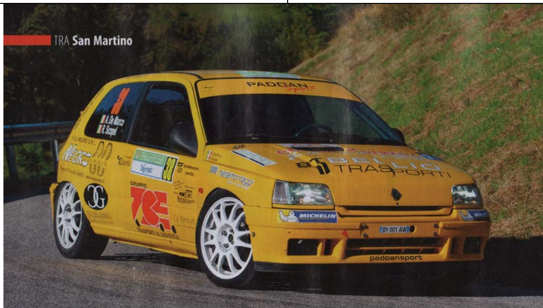
TRA San Martino